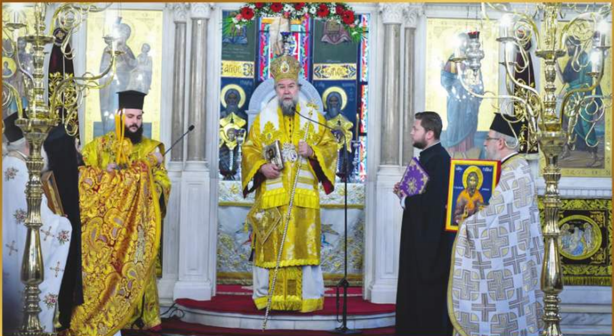
Θεία Λειτουργία εις τόν Ιερόν Μητροπολιτικόν Ναόν Παμμεγίστων Ταξιαρχών Σερρών (01-03-2026).