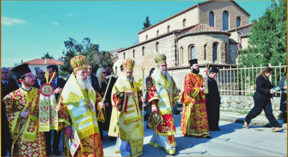
Πανηγυρική Πολυαρχιερατική Θεία Λειτουργία εις τόν έορτάζοντα Ιερόν Καθεδρικόν και Προσκυνηματικόν Ναόν τών Αγίων Θεοδώρων Σερρών (28-02-2026).